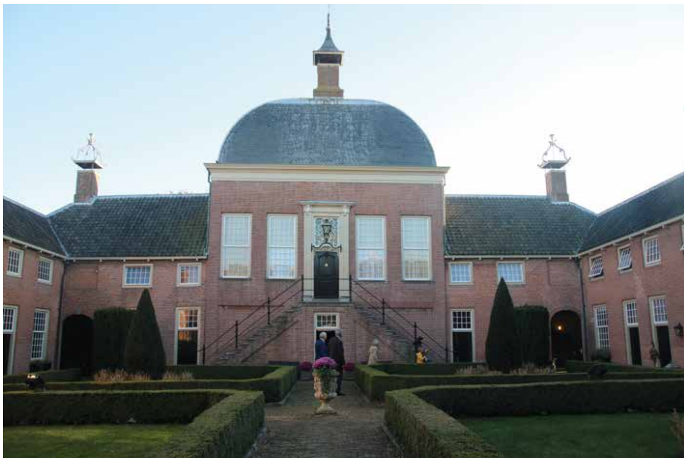
Het hofje aan de binnenkant met het fraaie regentenhuis met zijn kenmerkende koepel.