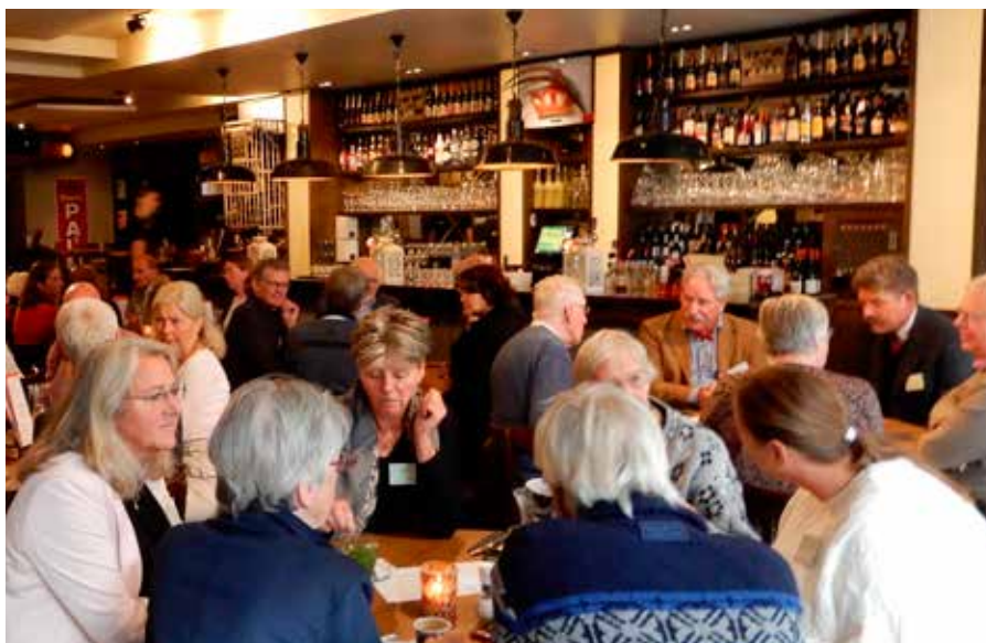
Tijdens de smakelijke lunch werd ook gesproken over geestelijke voeding.