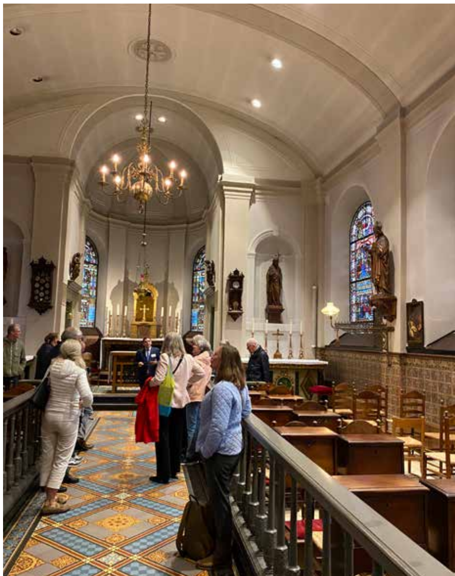
De huismeesters kregen uiteraard een rondleiding door het fraaie Bredase Begijnhof.

lieke kerk te stichten in het Begijnhof, de huidige Catharinakerk. In 1990 overleed de laatste begijn, waarna het Begijnhof eigenlijk meer een hofje is geworden.