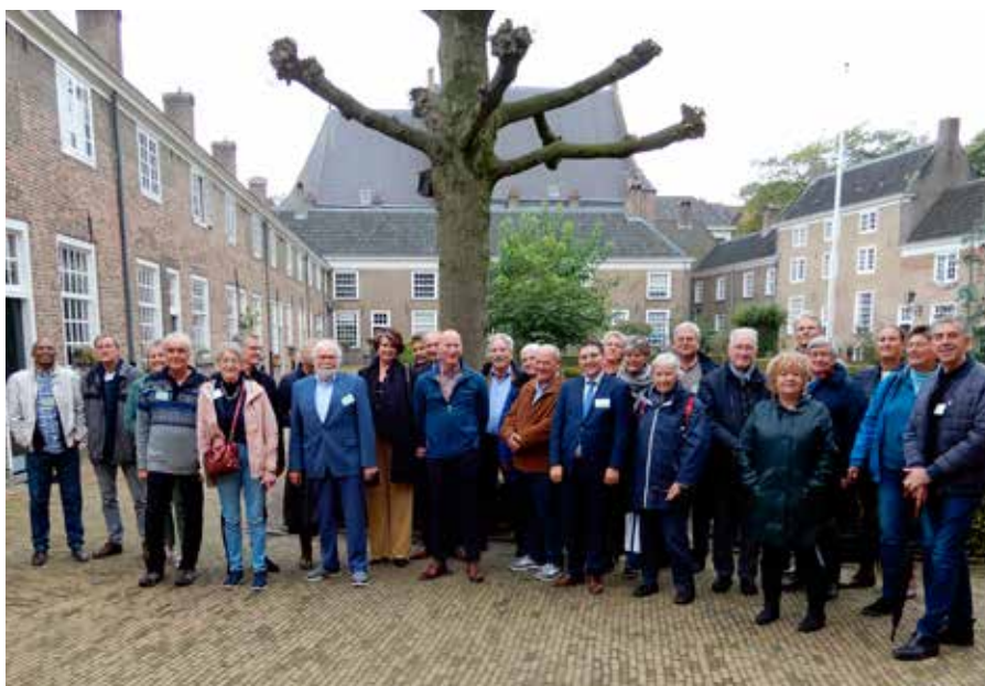
De huismeesters bijeen in het Bredase Begijnhof.