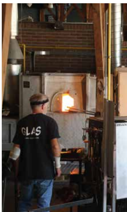
De glasblazer aan het werk.

De notulen van de Najaarsvergadering zijn de deelnemers inmiddels toegestuurd.