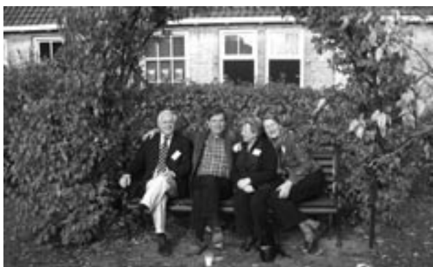
Het Haarlemse Frans Loenenhofje en het Dordtse Regenten- of Lengenhof vonden elkaar in de tuin van het Amersfoortse Pothhofje

De Hofjeskrant is voor geïnteresseerden op aanvraag beschikbaar. Bestuursleden van de aangesloten hofjes krijgen de krant automatisch op hun thuisadres.