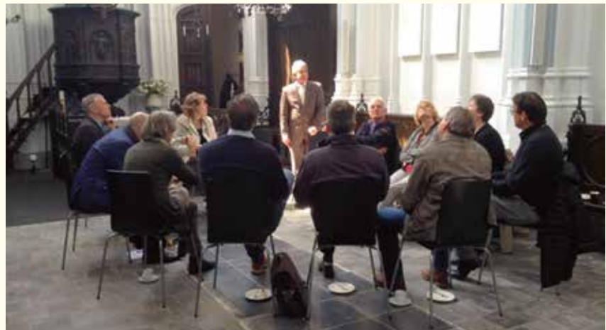
Kennissuitwisseling op 30 april 2015 in de Lutherse kerk te Den Bosch.

sloten. Deze organisaties zetten zich op landelijk, regionaal of lokaal niveau in voor de restauratie, herbesteding en het behoud van monumenten. Sinds kort heeft ook het LHB zich bij de LFHBH aangesloten.