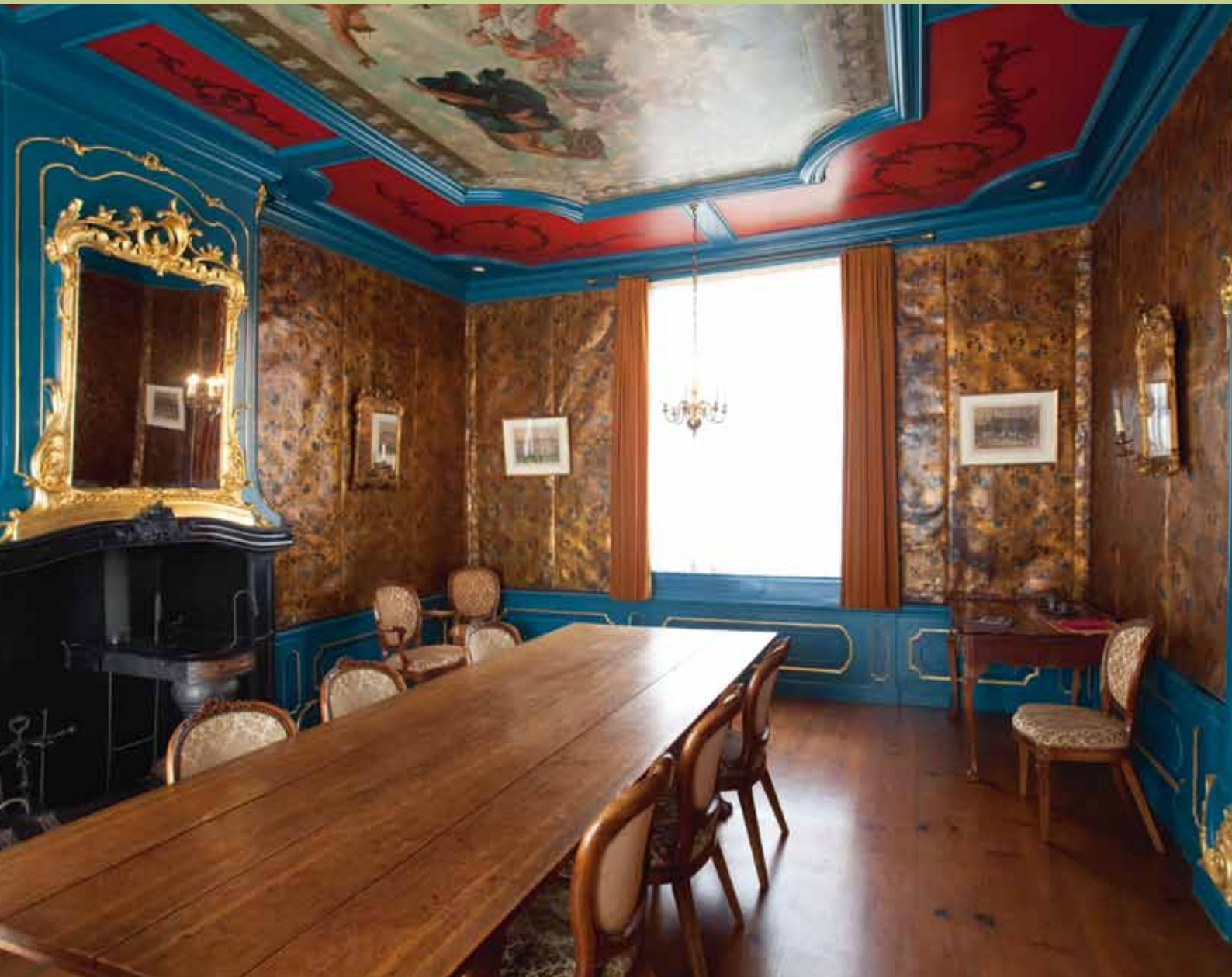
Regentenkamer van Sint-Pietershof, Hoorn.