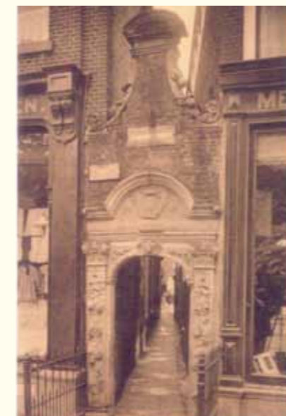
Het Popta- of Struivingspoortje vóór de in 1915 uitgevoerde restauratie.

Het bevat onder andere een boeiend opstel van Kees Kuiken over de achterliggende beweegredenen van de stichters van hofjes, van de late Middeleeuwen tot Popta's tijd. Was het aanvankelijk de bedoeling dat de bewoners tot in de