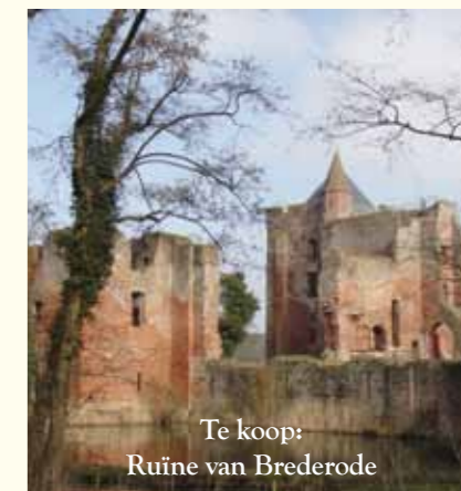
Te koop: Ruïne van Brederode

http://nationalemonumentenorganisatie.nl/wp-content/uploads/NMo-Visie-document.pdf