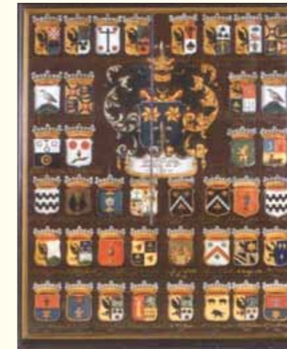
Wapenbord met de familiewapens van de eerste veertig voogden